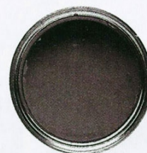
Suita Ecrú/Dekorál Color System Dekorál .80 zł/2,5 l

FRONTY SZAFEK są z lakierowanej na mat płyty MDF, blat roboczy – z czarnego granitu. Ścianę nad nim zabezpieczono lakierowanym szkłem lacobel. Na podłodze w kuchni i pokoju leżą płytki gresu różniące się odcieniem i wielkością.