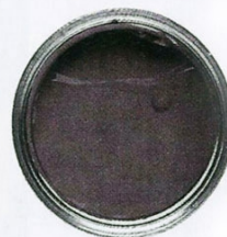
Sea Life, Benjamin Moore .64 zł/l