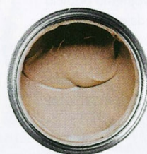
Aralia/Bondex Super Wall Bondex .57,50 zł/2,5 l